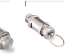
Válvula Alívio de Pressão Inox Rodoviário BSP 3/4" - 2kg/cm 2