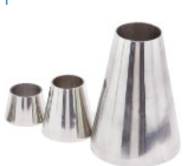
Redução Concêntrica Pipe Inox Solda OD