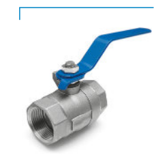
Válvula de Esfera Monobloco 1000 WOG