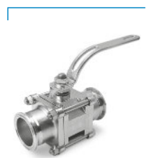
Válvula de Esfera Tripartida 400Psi com Conexão para Tubo OD