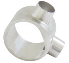
Corpo Bomba Sucção