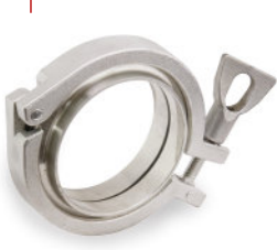
União TC Tri clamp Inox Solda OD