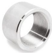
Luva BSP ou NPT Rosca Interna