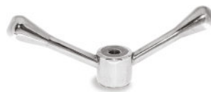
Manipulo Trava Inox Rosca Latão