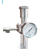
Válvula Controle Inox (Tanque Fermentação)