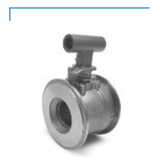
Válvula de Esfera Wafer Classe 150