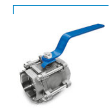
Válvula de Esfera Tripartida Série 1000 Classe 300