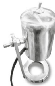
União Visor com Luminária