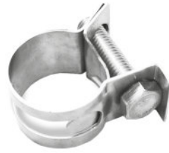
Abraçadeira Mangote Inox