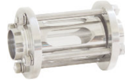
Visor Linha Tubular