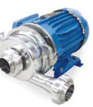
Bomba Centrífuga Sanitária - Inox Blindado IP55