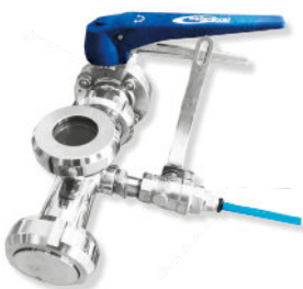
Carbonatador para cerveja