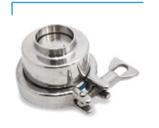
Válvula Retenção Sanitária - Abraçadeira Inox Solda OD