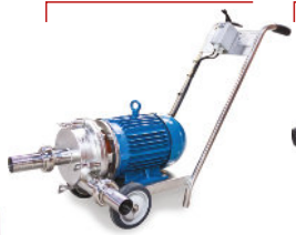
Bomba Centrífuga Sanitária Inox - Carro