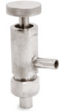
Torneira Tiragem Amostra Saca Amostra