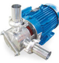
Bomba Sanitária Sucção Rotor Borracha