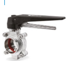
Válvula Borboleta Sanitária Aliviada - Inox Solda OD Manípulo Caltraca