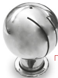
Spray Ball Rotativo