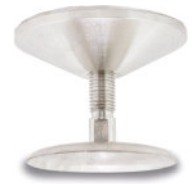
Sapata Regulável Tanque Inox