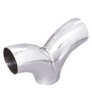
Y Duplo Pipe