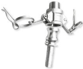
Adaptadores Cam Lock