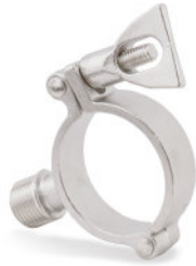
Abraçadeiras Suporte Tubo