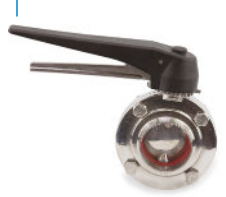
Válvula Borboleta Sanitária Maciça - Inox Solda OD Manípulo Caltraca