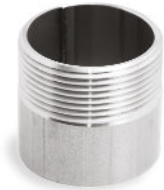
Niple Ponteira Rosca BSP ou NPT X Solda SCH