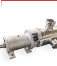
Bomba Autoaspirante Inox - Cardan Tanque Rodoviário