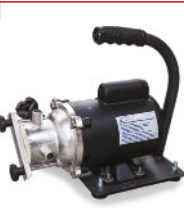
Bomba Transferência Líquidos 1/2" CV