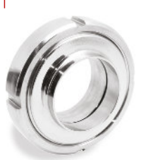
União DIN Completa Inox Solda OD