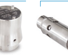
Válvula Alívio/Quebra-Vácuo Rodoviário Inox 316 2"