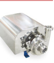
Bomba Centrífuga Sanitária Inox - Capa