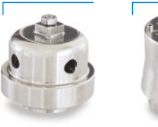
Válvula Alívio/Quebra-Vácuo Inox Solda OD 2"