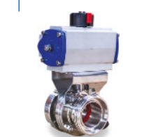
Válvula Borboleta Sanitária Maciça - Inox Atuador Pneumático