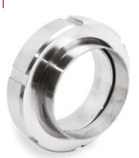
União RJT Completa Inox Solda OD