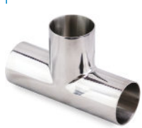
Tee Reto Pipe Inox Solda OD