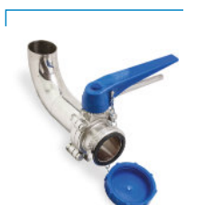
Válvula Borboleta Sanitária Aliviada - Resfriador Completa SMS ou RJT