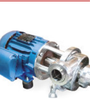
Bomba Centrífuga Sanitária - Inox Blindado IP55 Longa