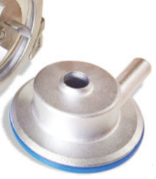
Bomba Centrífuga Sanitária Monofásica Mini Bomba